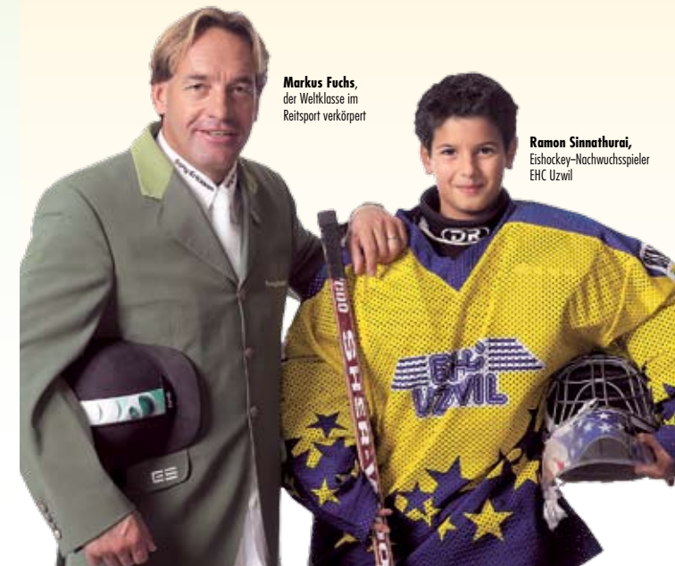
Markus Fuchs, der Weltklasse im Reitssport verkörpert