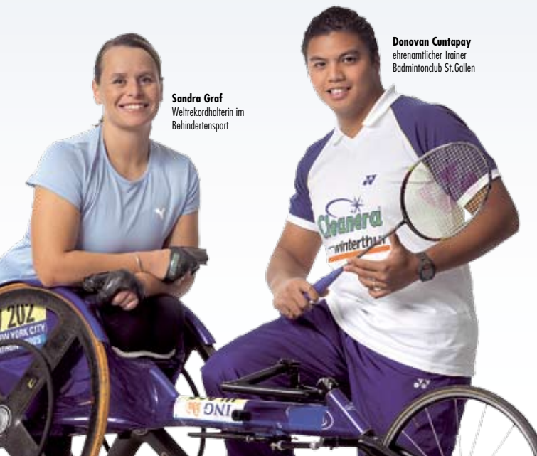
Sandra Graf Weltrekordhalterin im Behindertensport

Sportorganisationen mit Qualitätslabel profitieren im Alltag in ihrer Vereinsarbeit von den konkreten Hilfestellungen von «Sport-verein-t» und werden zudem mit höheren «Sport-Toto»-Subventionen belohnt. Bereits anerkennen zahlreiche St.Gallische Stadt- und Gemeindebehörden das Gütesiegel und honorieren die damit verbundenen ehrenamtlichen Zusatzaktivitäten, welche zum Wohle der Gesamtbevölkerung erbracht werden. «Sport-verein-t» wird von allen 40 Mitgliedsverbänden der IG St.Galler Sportverbände mitgetragen.